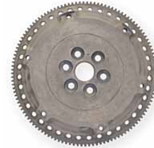
PEUGEOT Volano FLYWHEEL