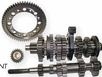
A112 ABARTH Cambio RACING GEAR KIT DOG ENGAGEMENT