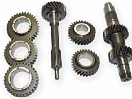
BMW M3-E30 Cambio RACING GEAR KIT DOG ENGAGEMENT