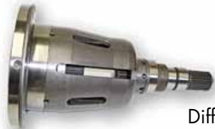
RENAULT CLIO RS/WILLIAMS Differenziale Autobloccante LIMITED SLIP DIFFERENTIAL (LSD)