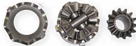
Gruppo Interno Differenziale INSIDE GROUP LIMITED SLIP DIFFERENTIAL (LSD)