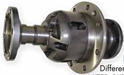
LANCIA DELTA S4 Differenziale Autobloccante LIMITED SLIP DIFFERENTIAL (LSD)